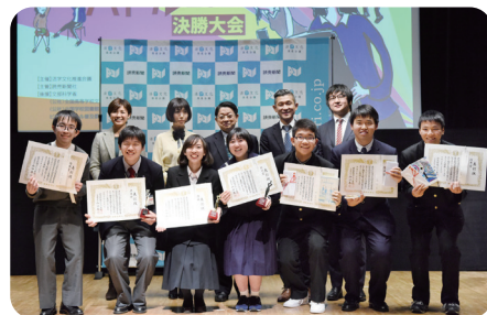
今年1月の決勝大会表彰式の様子

【日程】2019年1月20日(日) 【会場】よみうり大手町ホール(東京都千代田区)